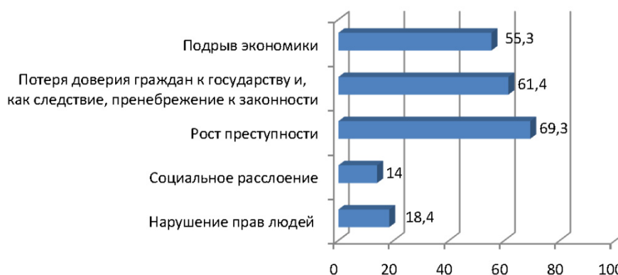
Рис. 2. Последствия коррупции (в процентах от общего числа опрошенных респондентов)

В то же время основными последствиями коррупции, по мнению большинства участников опроса, являются однозначно негативные явления: «рост преступности» (69,3 %), «потеря доверия граждан к государству и, как следствие, пренебрежение к законности, что подрывает саму основу государства» (61,4 %), а также «подрыв экономики» (55,3 %). Обнаруживается конфликт: с одной стороны, для части респондентов коррупционные действия являются способом более эффективно решать повседневные проблемы, с другой стороны, ими признается явно деструктивное влияние такой практики на социальную жизнь (рис. 2).